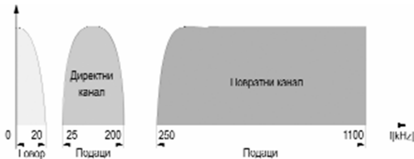
а) Фреквенцијско мултиплексирање

Drugi pristup je sistem sa više diskretnih tonova DMT ( Discret MultiTone ). DMT tehnika sastoji se: